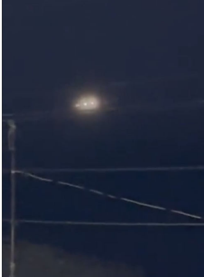
Fotograma tomado del video publicado por Metr poliMX

El siguiente informe pretende determinar las causas que originaron los Elementos Aeroespaciales inicialmente no identificados y que fueron captados por diferentes testigos ubicados en las zonas geográficas de Zapopan, Tlaquepaque, Guadalajara, Tlajomulco y Chapala.